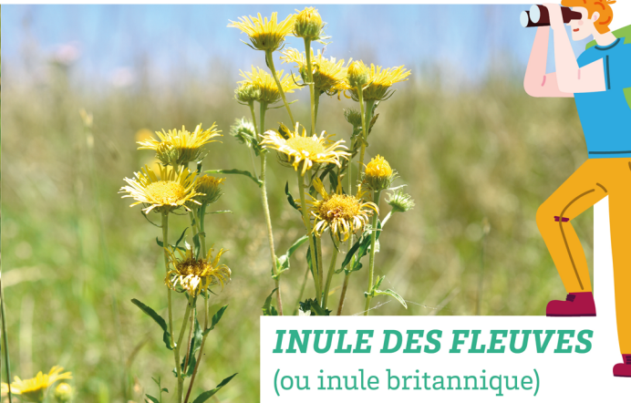
INULE DES FLEUVES (ou inule britannique)

Plante qui croît dans les prairies inondables du Val de Saône. Elle a été retrouvée en 2022, à Gray-la-Ville, après plus de cent ans sans avoir été mentionnée dans ce secteur. Elle ressemble à une marguerite toute jaune et fleurit autour du 14 juillet. Elle est à rechercher dans les prairies le long de la Saône et de l'Ognon.